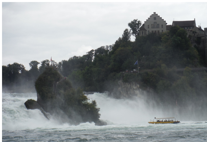
2014 Rheinfall, Schaffhausen