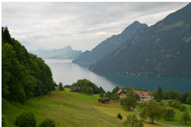
2012 Vierwaldstättersee, Seelisberg